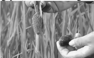
Ốc bươu vàng gây hại cho mùa màng -

Trong thời gian qua, nhiều loài ngoại lai xâm hại đã xuất hiện và gây ảnh hưởng tới đa dạng sinh học và tổn thất kinh tế. Trước đây, ốc bươu vàng ( Pomacea canaliculata ) được nhập về nhằm mục đích phát triển kinh tế. Tuy nhiên, sau một thời gian, ốc bươu vàng đã trở thành đại địch làm điêu đứng ngành nông nghiệp Việt Nam và đến nay, loài này vẫn gây hại cho mùa màng.