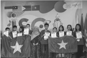
4 học sinh Việt Nam đoạt Huy chương Vàng tại Kỳ thi khoa học quốc tế ISC năm 2019.

quốc tế lần thứ nhất năm 2019, đoàn Việt Nam đã đạt được thành tích ấn tượng khi cả 39 học sinh đều đoạt giải với 4 huy chương vàng, 10 huy chương bạc, 14 huy chương đồng, 11 giải khuyến khích.