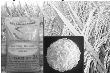
Gạo ST24 được bình chọn là loại gạo ngon nhất thế giới.

Tại hội nghị, giống gạo ST24 của Việt Nam do nhóm Sản xuất Gạo Chất lượng cao của Sóc Trăng đã được bình chọn là loại gạo ngon nhất thế giới.